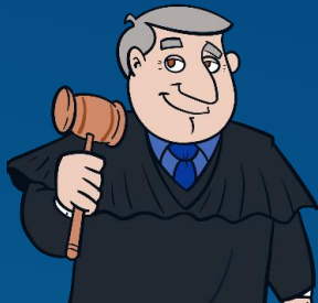
B.J BASE JURIDICA