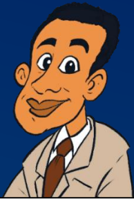
DPO - DAVIS