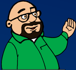
DPO - BABILON