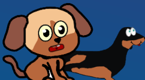
TEDDY / TOY