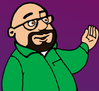
DPO - BABILON