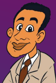
DPO - DAVIS